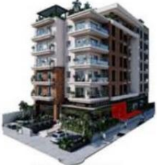
VISTA CALLE HAMBURGO