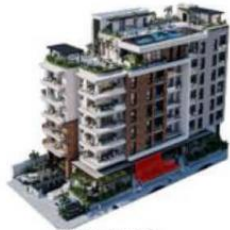
VISTA CALLE ESPAÑA