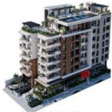
VISTA CALLE ESPAÑA