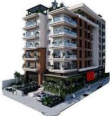
VISTA CALLE HAMBURGO